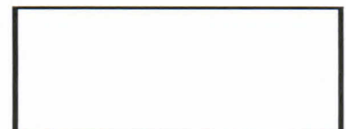
PARAF PETUGAS KONSULER